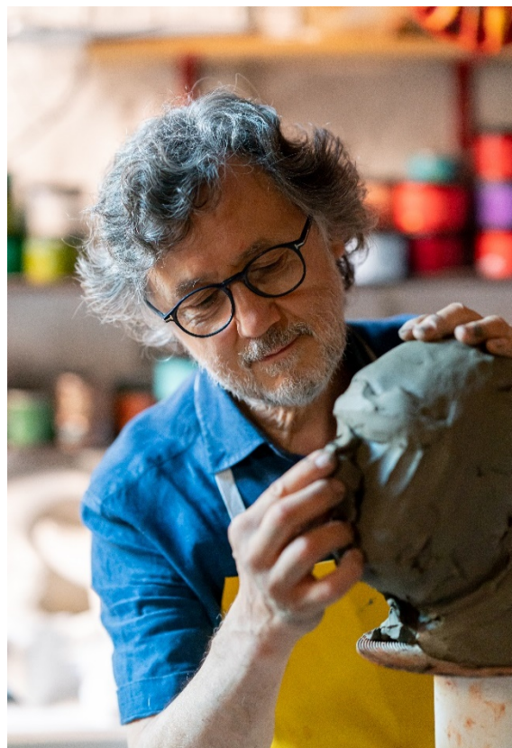
Fabricant de masques de l'atelier Ca'Macana à l'ouvrage

À l'aide du site Web et de l'application dédiés, vous organisez votre parcours unique au travers des rues de Venise et des faubourgs alentour, où vous découvrirez la créativité et le savoir-faire qui imprègnent la ville. Vous pourrez partager le quotidien d'un atelier, revivre certains métiers artisanaux ancestraux, découvrir une exposition et acheter des objets qui auront pris forme sous vos yeux.