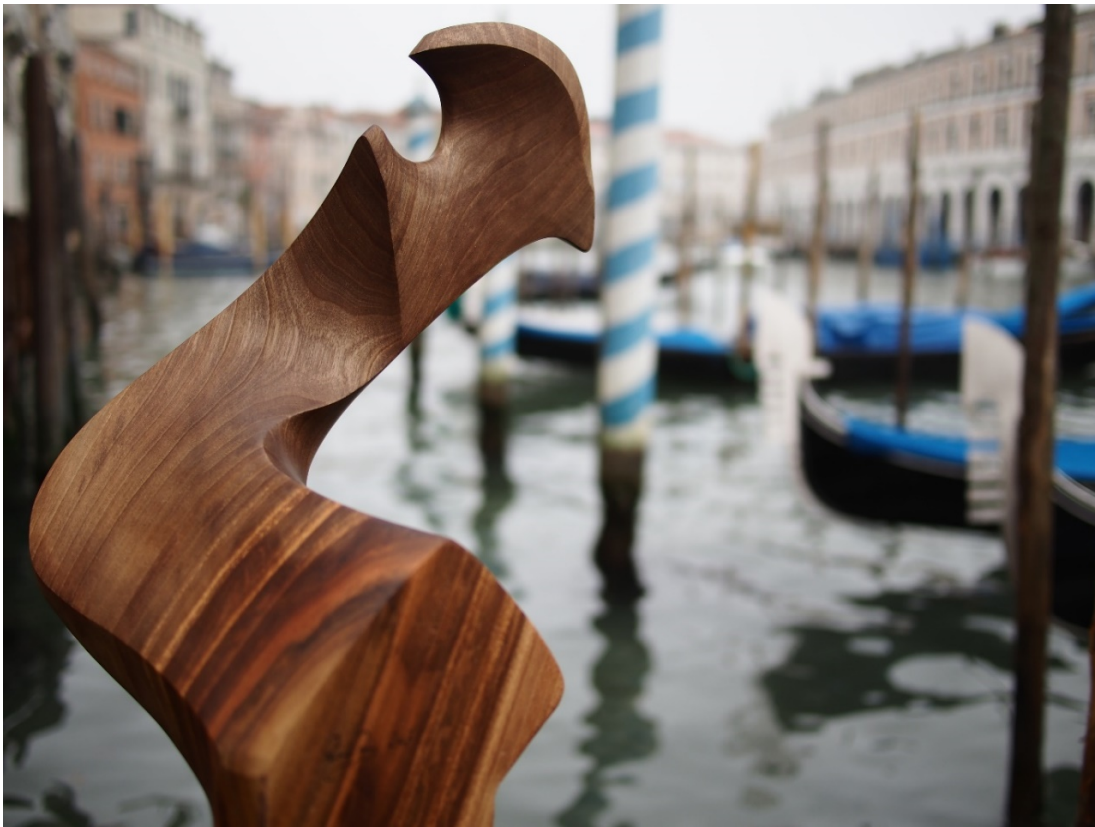
Œuvre réalisée par le sculpteur de forcole , Piero Dri

Créez votre propre parcours de visite et partez à la découverte des ateliers dissimulés à travers la ville